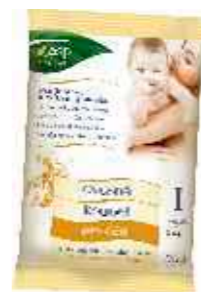
6 sáčků po 25 g.