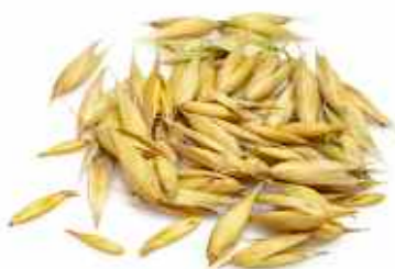
3 sáčky po 50 g.